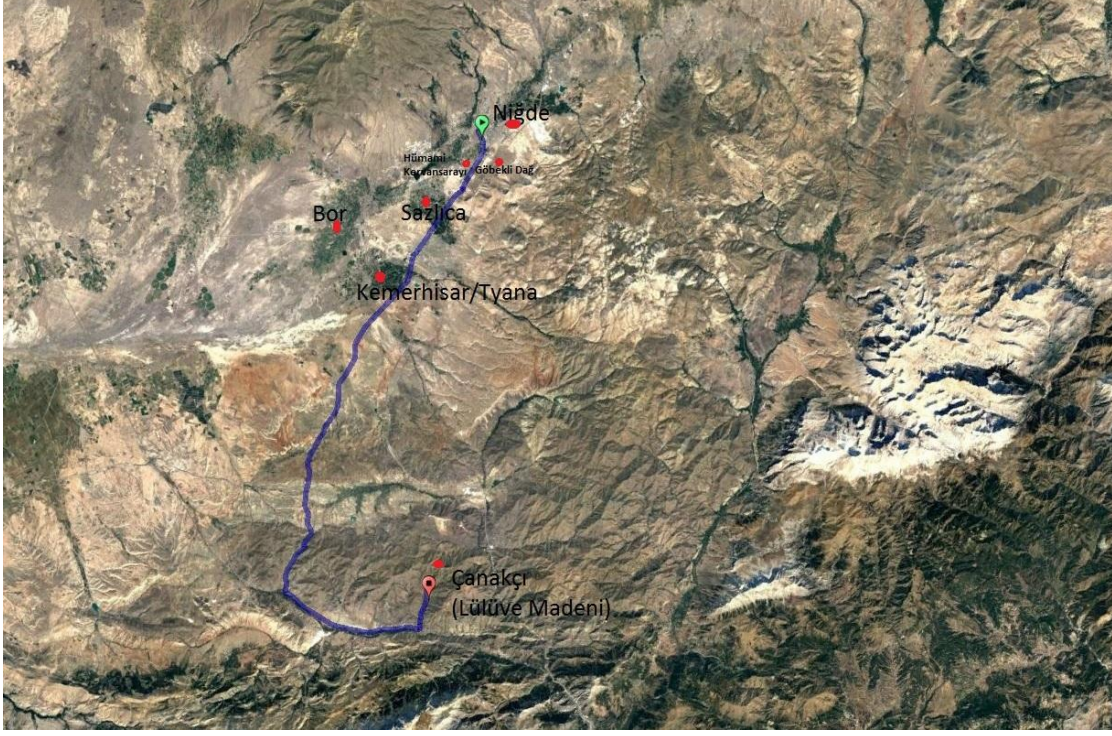
Resim 2: Niğde-Lülüve Yolu