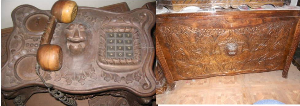
Resim3: Kahramanmaraş Pars Motifli Telefonluk, (Hacer Arıkan 2009 )- Pras Motifli Kahramanmaraş Çeyiz Sandığı (Fatih Bayraktar)

Anadolu Selçuklu ahşap eserlerinde İnsan ve hayvan motiflerine çok az rastlanmakla beraber kullanılan eserlerde farklılıklar ortaya çıkmaktadır. Ortada güneş motifi ve sarmalar içersinde yer alan hayvan motifleri günümüzde de Kahramanmaraş ahşap eserlerinde karşımıza çıkmaktadır. (Resim 4 )