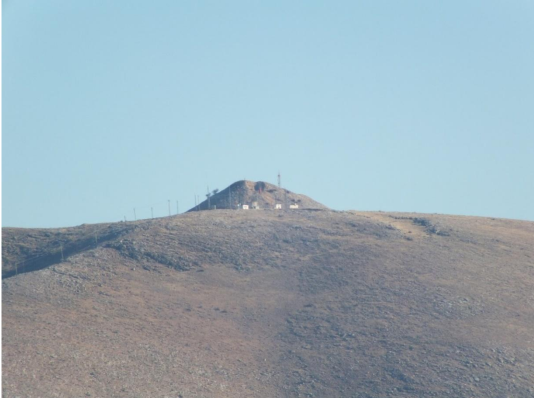
Resim 2:Göbekli Dağ