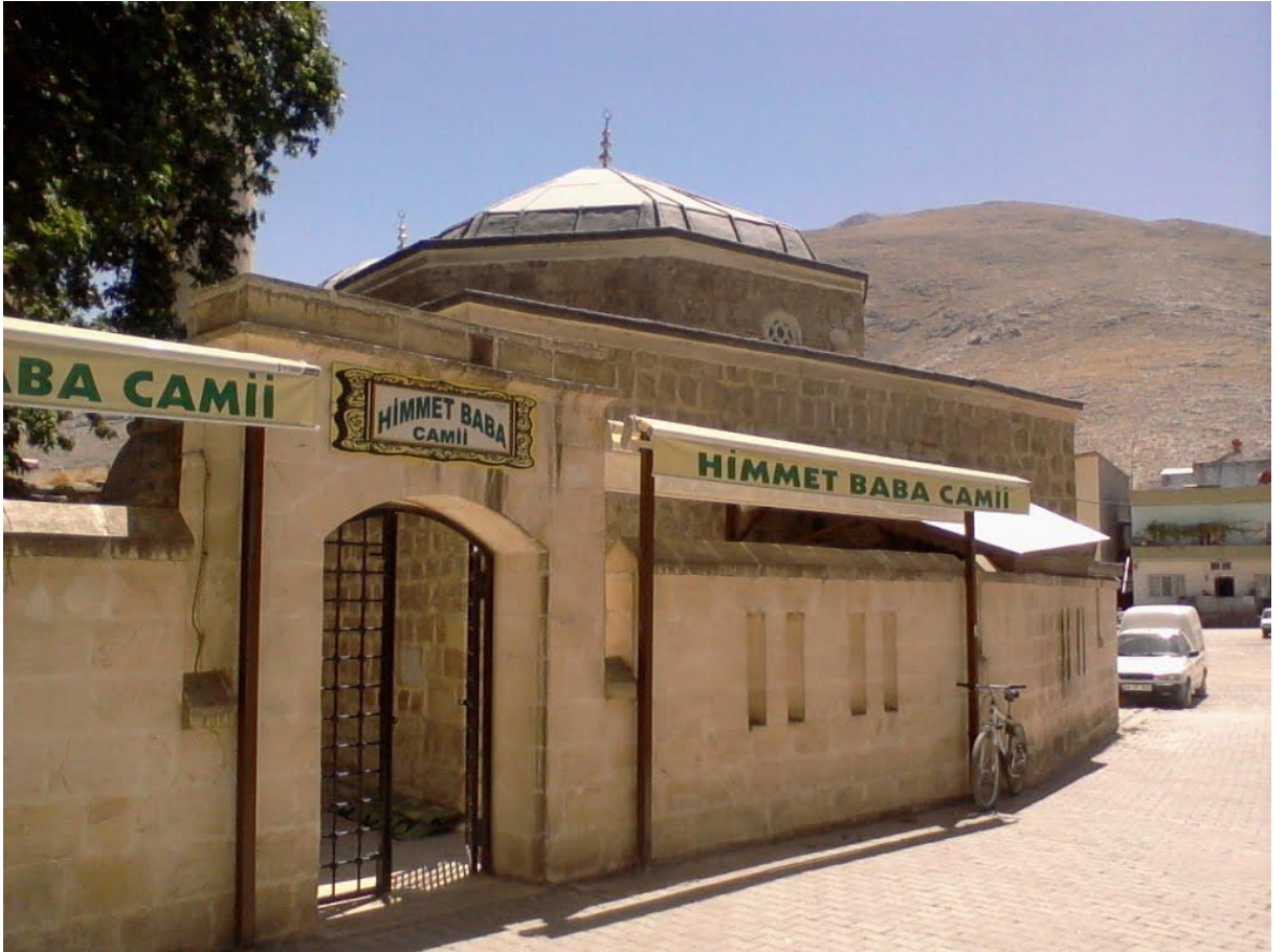
Resim: Himmet Baba Camii ve Türbesinin görünümü