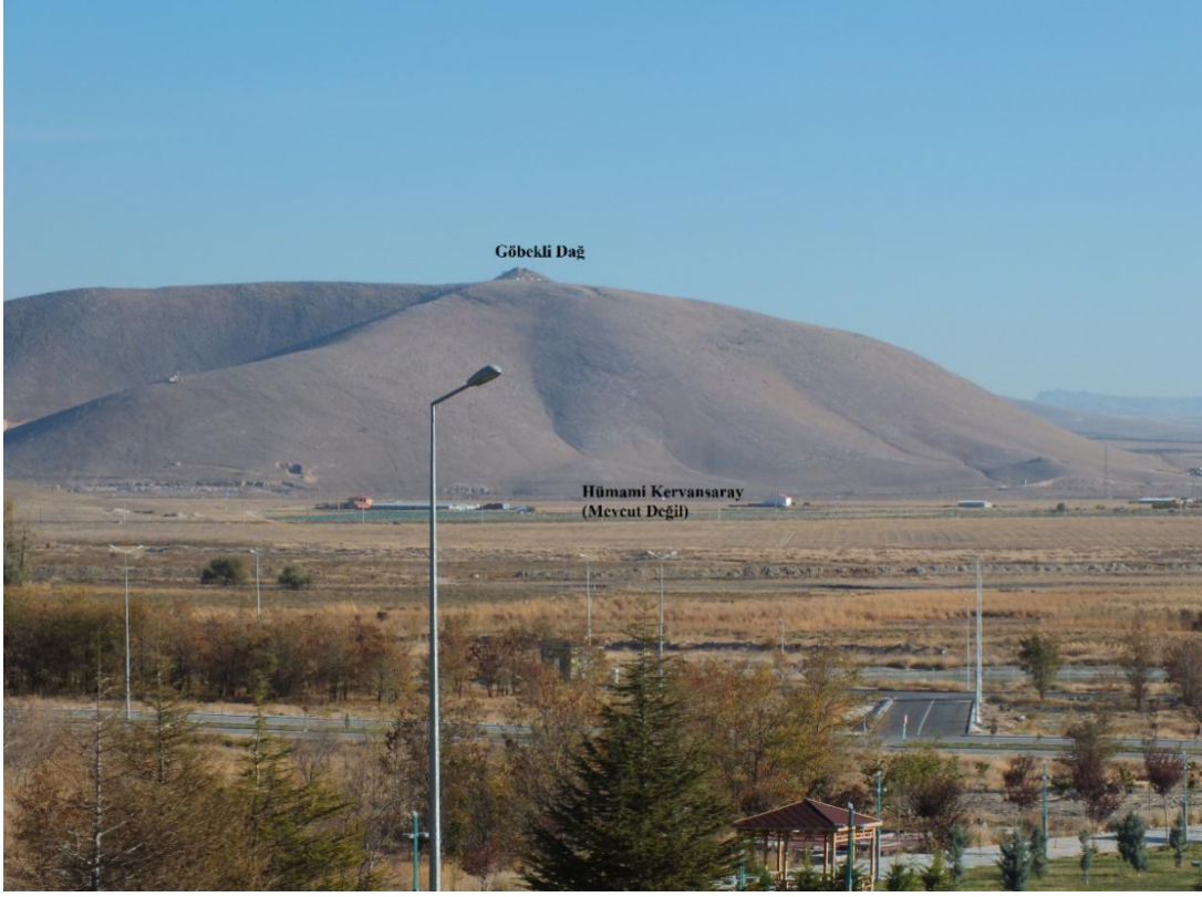
Resim 1:Göbekli Dağ