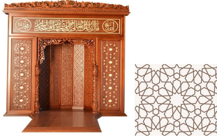
Resim 7: Kahramanmaraş Mihrap Örneği ( Gülalçı Ahşap Oyma)- Selçuklu Dönemi Yıldız Deseni Örneği

Anadolu Selçuklu Döneminde daha çok kündekari tekniği üzerinde durulmuş ve sedef, bağa ve fildişi gibi maddelerde bu teknik uygulanarak, çok özel örnekler sergilenmiştir. 1215 Kündekari Farsça'dan dilimize geçmiş, asıl hali kende-kâri olan bir kelimedir. Fakat İran'da bu kelime "mütenebihe" Araplarda ise "ta'şik" adıyla anılmaktadır. "Kündekari" kelimesini sadece Türkler kullanmaktadır. 1216 Kündekari, birbirine geçme sistemiyle, küçük ve düzgün geometrik ahşap parçalarıyla yapı elemanlarının yüzeyinde yapılan ahşap süsleme tekniğidir. 1217 (Resim7-8) Günümüzde Kahramanmaraş da Kündekari tekniği: mimberlerin yan aynalıkların da ve kapılarda kullanılmaktadır.