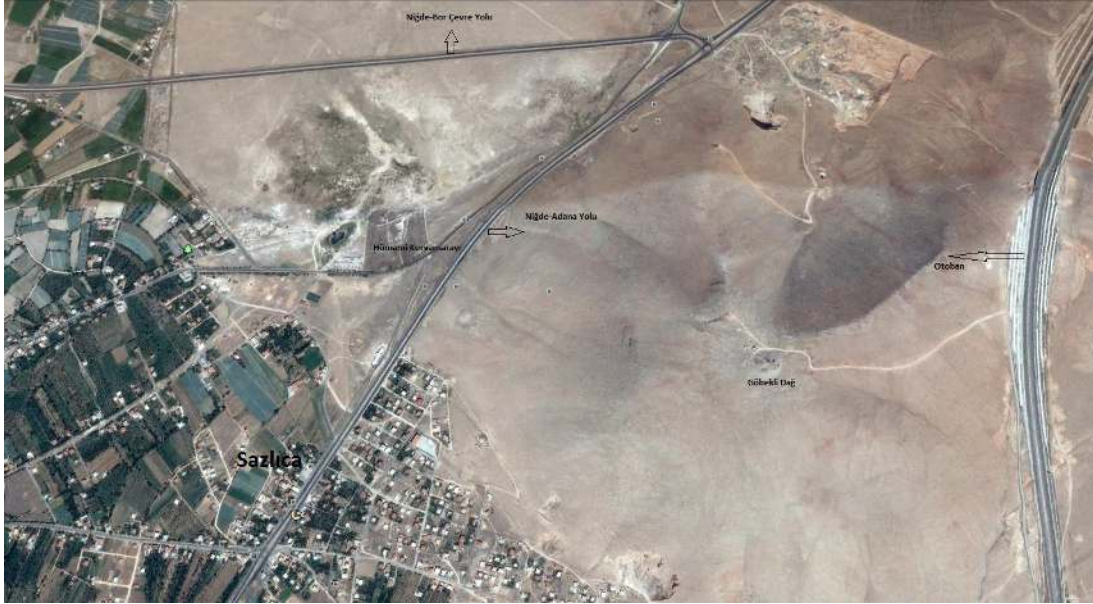
Resim 3: Göbekli Dağ