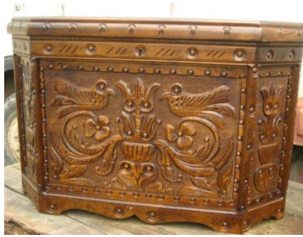
Resim 6: Hayat Ağacı ve Kuş Motifli (Kapalıçarşı)

Orta Asya Şaman kaynaklarına göre hayat ağacı dünyanın merkezi ve bu merkezden çıkan eksenidir. Yer altıyla gökyüzü arasındaki seyahatin bir merdivenidir. Bolluk ve bereketin sembolü olarak da kullanılmaktadır. Hayat ağacı sembolü Anadolu Selçuklu ahşap eserlerinde ilginç bir şekilde karşımıza çıkmaktadır. Ahşap oyma sanatının en güzel örneklerinin yaşatıldığı Kahramanmaraş sandıklarında da Hayat ağacı sembolü çeşitli şekillerde stilize edilerek karşımıza çıkmaktadır. 1214 (Resim 6)