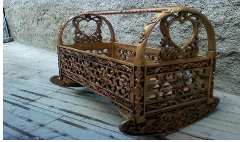
Resim 1: Beşik -Oymalı Köşk Ceviz Oymacılık İmalat

Selçuklulardan günümüze kalan ahşap eserlerde geometrik desenlerin yanı sıra bitkisel motifler, yazı ve çok az olarak da figür kullanılmıştır. Çiçek, nebat ve hayvan şekillerinden stilize edilerek meydana getirilen geleneksel motifler mobilya ve süs eşyaları üzerine işlenmektedir. Çeyiz sandığı, rahle, gazetelik, şifreli ziynet kutusu, aynalık, isimlik, tepsi, tavla, salon sehpası, televizyon sehpası, camekân, dolap, vitrin, şamdan, sandalye, minber, vaaz kürsüleri vb. ürünler üretilmekte, yurtiçi ve yurt dışına satışı gerçekleştirilmektedir. Günümüzde özellikle camilerin iç mekânlarının döşeme ve kaplamalarında oymacılık ürünleri kullanılmaktadır. 1210