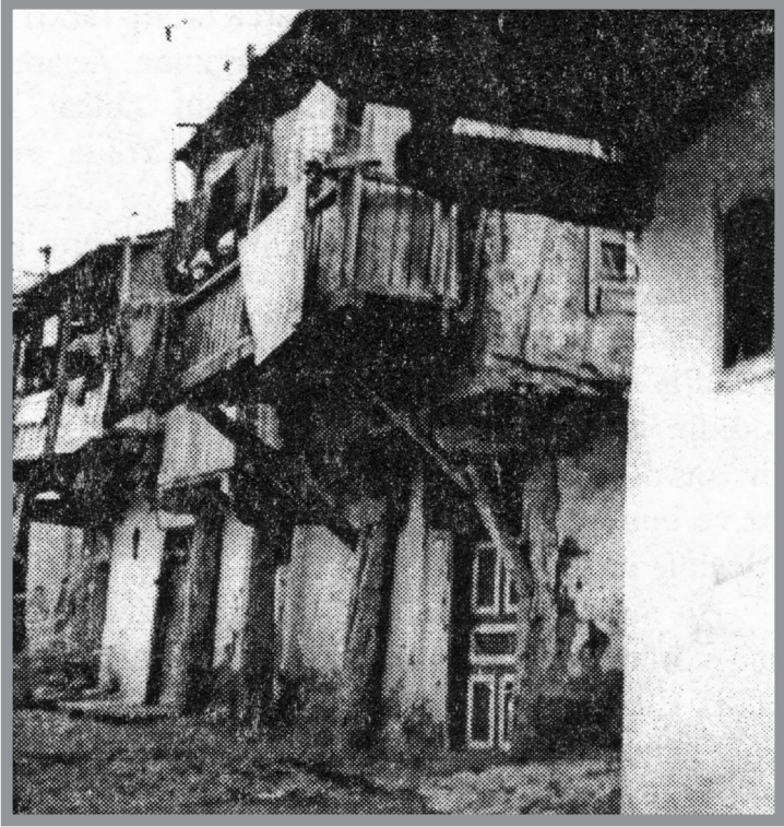
Rahmi Eray'ın babasının Elbistan'daki evi