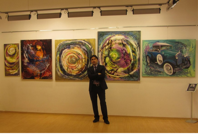
f. 81- Sergiden genel görüntü

Sosyal bir varlık olarak milyonlarca rengin tonunda farklı sesler, diller, yüzler, dokular, anlayışlar içersinde yaşamak zorunda kalıyoruz. Sanırım renklerin de iç içe sosyal bir ağ oluşturma yetisi var diyebiliriz.