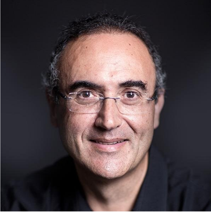
f. 76- Sunay Akın

Bir sanat adamı olarak gelen, bir Kahramanmaraş hayranı ve dostu olarak ayrılan Sunay Akın, 27. 03. 2010'da Sabancı Kültür Merkezi'nde izleyicileri saatlerce sahneye kilitledi. Sunay Akın'ı izlemek hele de yürek ve düşünsel derinlikle izlemek, sanat dostlarına bir fırsat ve doyum alanı oluşturdu.