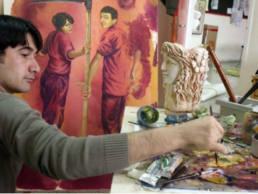
f. 92 - Ressamın özgün çalışmalarından bir görüntü