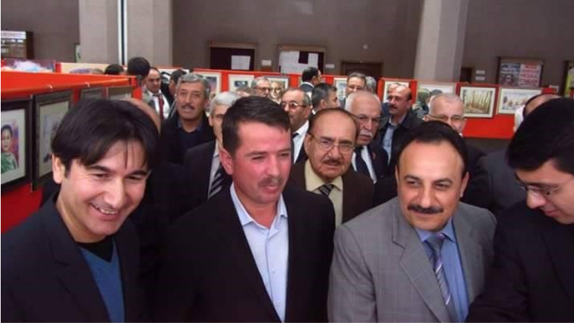
f. 91- Açılıştan bir görüntü

(Konuya girerken Sanata ve Sanatçı Değerlerimize Sahip Çıkalım Demek geçiyor İçimden)