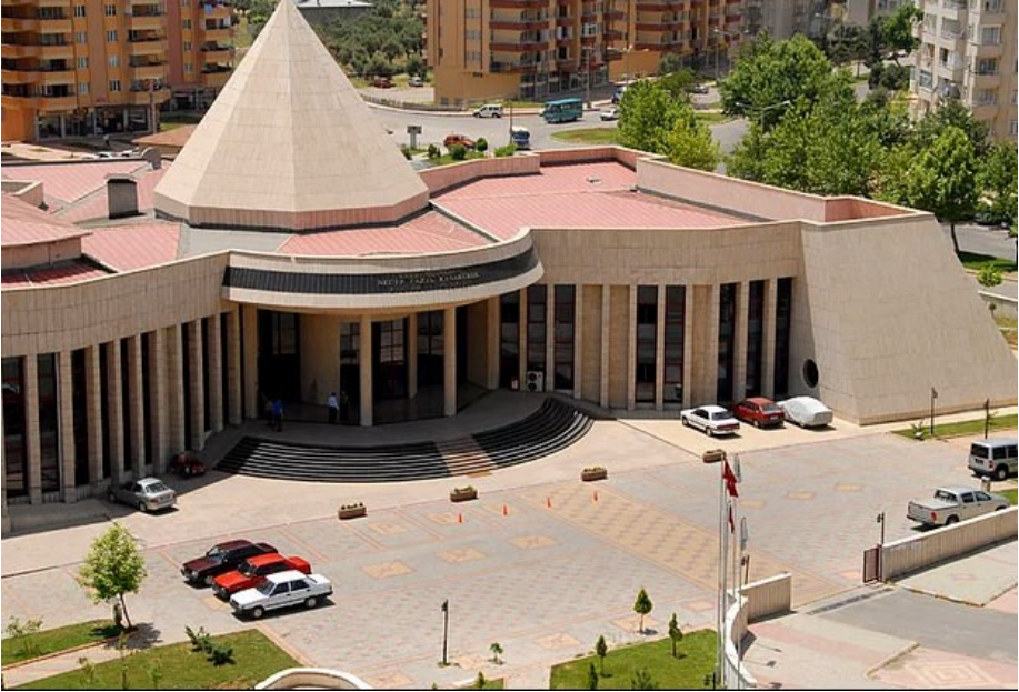
f. 23- NFKM.’den ön görüntü

Bu mekân söz konusu devir ve protokol gereğince “Necip Fazıl Kültür Merkezi” olarak 14 Ocak 2005’den itibaren hizmete girmiştir. Belediyemizde burada başarılı bir işletme düzeni kurulmuştur. Bu mekân iki tiyatro salonu, bir kütüphanesi, değişik salonları, kantini, sıhhi tesisleri ve dinlenme bölümleriyle tam bir site olarak sosyal, kültürel ve sanatsal etkinliklere kapısını açmıştır. İlk günlerde ilgi belki beklenenin altıdaydı. Ancak zamanla halkımızın söz konusu alanlardaki algısı değişip yetkinleştikçe, salonların doluluk oranı ve seyirci kalitesi de yükselmiştir. NFKM.’i açıldığından bu yana Belediye Konservatuarınca defalarca, Saz Heyeti eşliğinde Klâsik Türk Sanat Müziği, Türk Sanat Müziği, Tasavvuf Müziği, Halk Müziği, Mehter Müziği konserleri verilmiş; halkın müzik algısı ve hazzının yetkinleşmesine önemli katkı sağlanmıştır. Ayrıca konservatuarın diğer bölümü tiyatro da sahne alarak hayatın içini yansıtan oyunlarıyla tiyatro algısının değişimine öncü olmuştur. Özellikle otantik hayatın yansımalarında seyirci kendini bulma, sorgulama imkânına kavuşmuştur. Bu da “tayatura” algısından gerçek tiyatro algısına geçişi sağlamıştır, diyebiliriz.