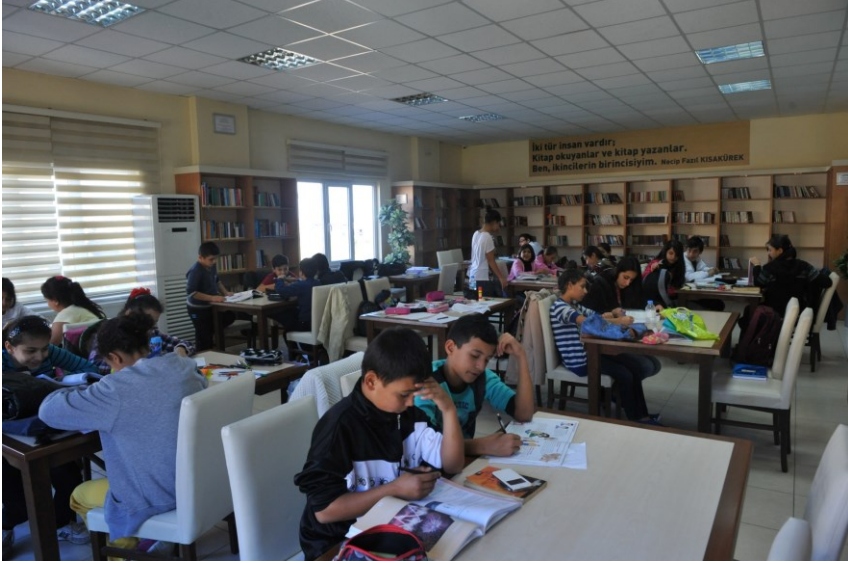
f. 26- Kütüphane okuma salonundan bir görüntü

Söz konusu Şube Müdürlüğü bugün itibariyle 16 Kütüphane ve 4 Müzeyle hizmet vermektedir. Hizmet alanında 1 Şube Müdürü, 10 Memur, 5 kadrolu İşçi, 66 hizmet alımı olmak üzere toplam 87 personel çalışmaktadır. Kütüphane ve müzeler haftanın 7 günü açıktır. Kütüphanelerin mesai saatleri: 08.00- 22.45, müzelerins e 08.00- 17.00 zaman dilimleridir.