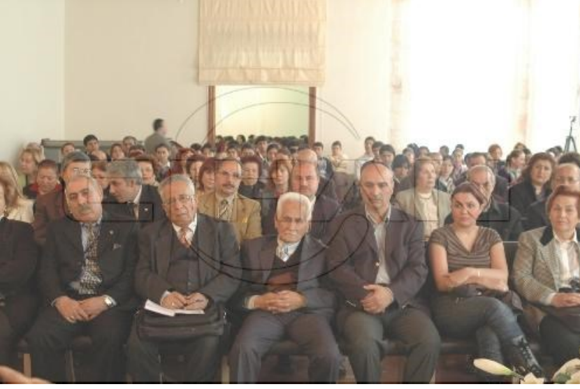
f. 57- Festivale katılımcı ve izleyicilerden bir grup