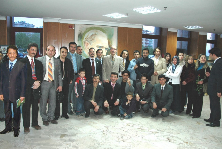
f. 60- İkinci. Karma Resim sergisine katılan ressamlardan toplu bir görüntü (25/ Nisan/ 2007)

Bir zamanlar Kahramanmaraş'ın kalbi Çocuk Bahçesi çevresinde atardı. Yazlık-kışlık sinemaları, okulları, eğlence yerleri, park alanları, Pınarbaşı ve Kale'de sahnelenen konserleriyle, gün batımı başlayan sosyal trafiğiyle bu çevre saat 24'e kadar yaşayan, soluk alan bir merkezdi, kent içinde.