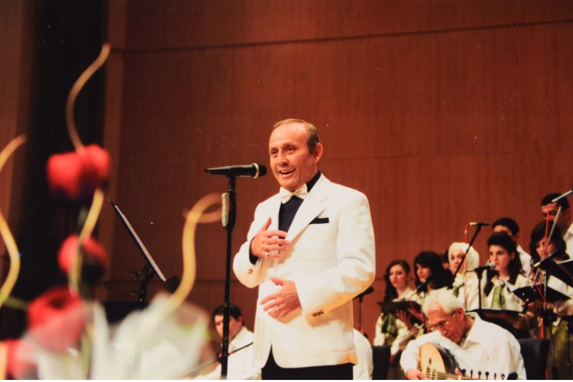
f. 84- Türk Tasavvuf Musikisinden zengin görüntüler