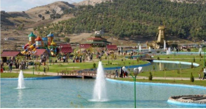
f. 24- Kılavuzlu kültür parkından bir görüntü