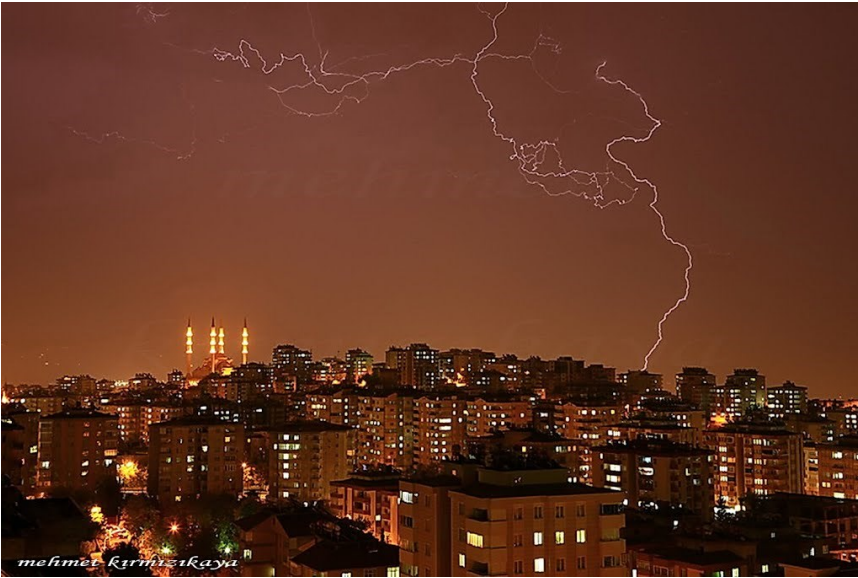
f. 47 Kahramanmaraş fotoğraf sergilerinden görüntüler