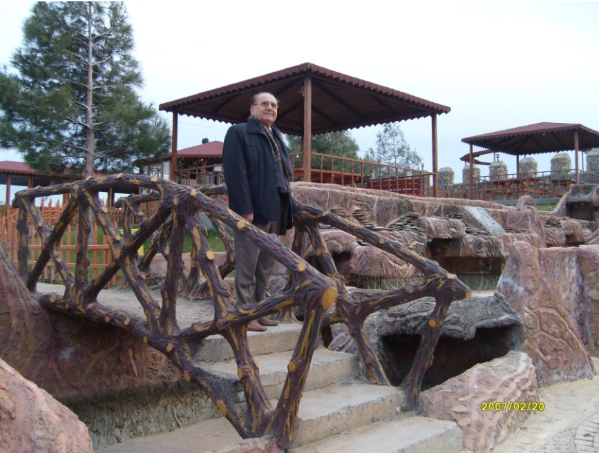
f. 25- Kültür parklarından sanatsal estetiği yansıtan bir görüntü

Kahramanmaraş Büyük Şehir Belediyemizce, 2014 yılında şehrimizin Pınarbaşı olarak bilinen semtinde 107 dönüm alanda kurulmuştur. Tesis estetik, sosyal ve sportif unsurlarıyla şehrimize farklı bir panorama kazandırmıştır. Spor kompleksi, dinlenme alanları ve peyzaj estetiğiyle ilgi çeken modern bir görünüm kazanmıştır. Şehrimizde ilk defa uygulanan sentetik paten pisti ve duvar tenisi, voleybol, basketbol,