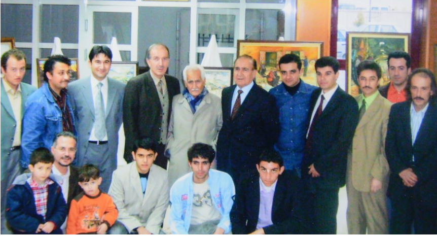
f. 41- Kahramanmaraş Güzel Sanatlar Grubunun Kurucuları