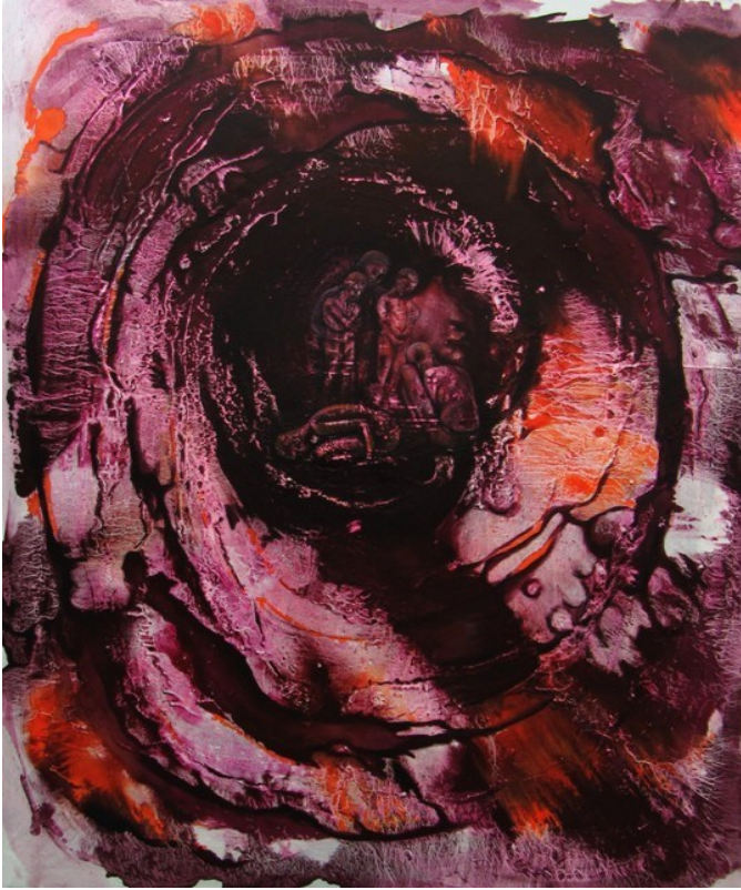
f. 80- Sergide döngü figürü