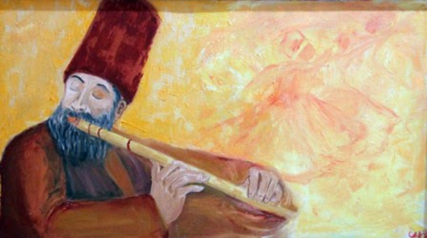
f. 74- Sergiden bir Mevlevî görüntüsü