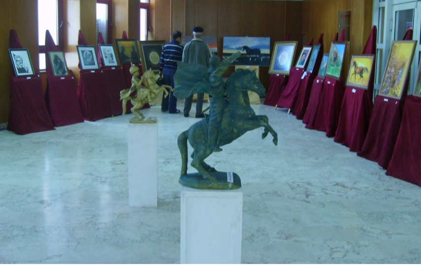
f. 61, 62- İkinci Karma Resim sergisinden görüntüler