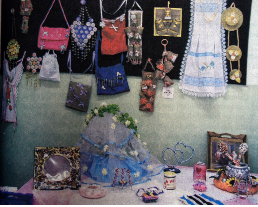
f. 12 - O günün kırsalında gelinlik genç kız çeyizlerinden bir görüntü