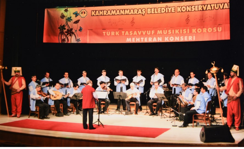
f. 90 Mehteran enstrüman'ıyla Türk Tasavvuf musiki konserinden bir görüntü