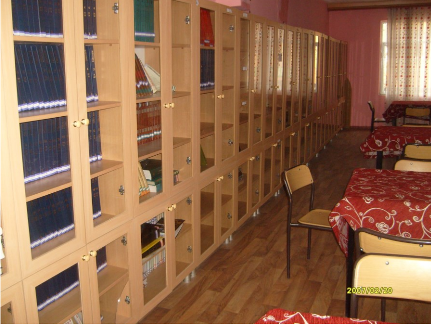
f. 66- Kütüphane- kitaplık salonu

Allah insanı iki geçeli bir bütün olarak yaratmıştır. Dış dünyamız- iç dünyamız. Nasıl ki dış dünyamızı elektrik aydınlatıyorsa, iç dünyamızı da kitaplar aydınlatır. Kitapların okunmak amacıyla düzenlendiği kurumlarsa