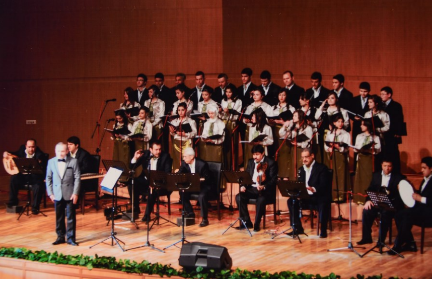
f. 68- Konserin saz ve koro bölümü