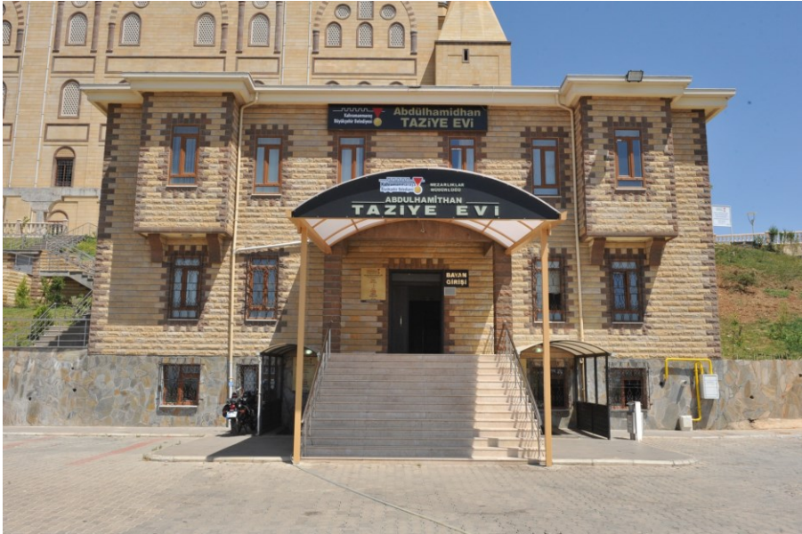
f. 27- Taziye evi ön görüntü

Taziye Evlerini, sosyalleşmenin, inanç boyutunda oluşan birlik-beraberliklerin, kaynaşmanın ve geleneksel ortak değerlerin bölüşülüp paylaşıldığı mekânlar olarak çok önemsiyoruz. Her mahalleye bir taziye evi ilkesinden yola çıkarak Belediyemizin öncülüğünde başlatılan bu hayırlı ve çok yararlı hizmet binalarının yapımına hızla devam edilmektedir. Bugün gelinen noktada Taziye Evleri halkımız tarafından çok benimsenmiştir. Bu mekânlar genelde iki salonlu (kadın-erkek), yemekhane, mutfak ve diğer sıhhi bölümlerden oluşmaktadır. Son derece kullanışlı tesisler olarak inşa edilmektedir.