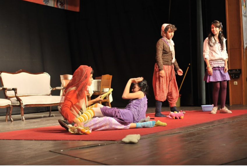
f. 73 - Oyundan başka bir bölüm