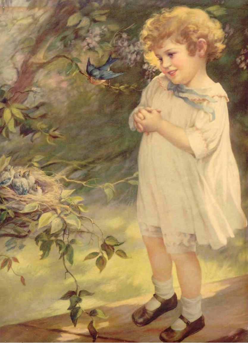
f. 75- Sergiden başka bir görüntü

Yeni bir resim sergisinde buluşma dileğimle.