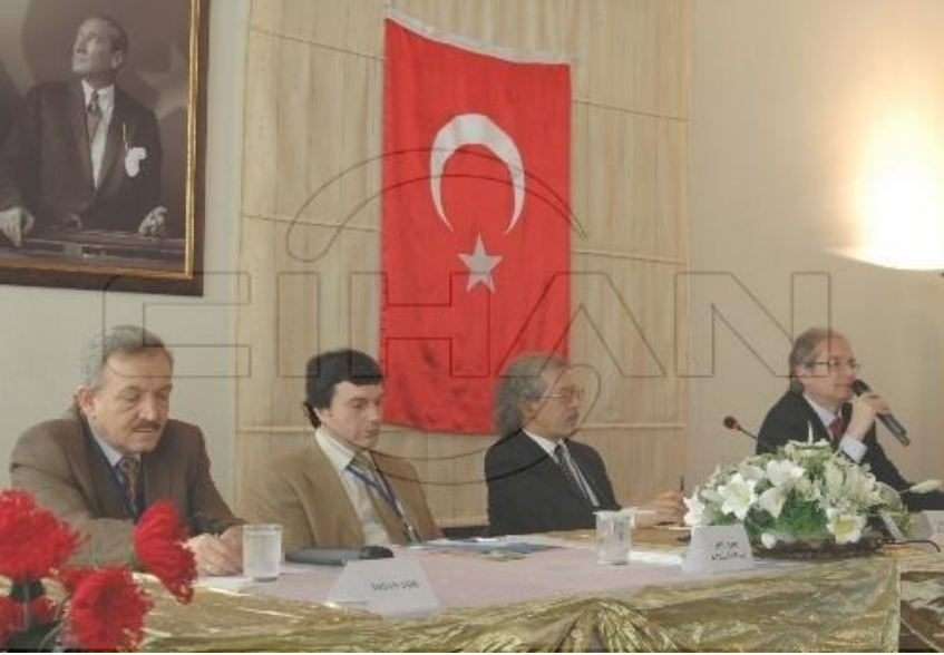
f. 58- Panel çalışmasından bir görüntü

İnsanların görüldüğü gibi olmaması, kavram kargaşasına neden olan maskeleye onu derinden yaraladı. Her şeye kuşkuyla bakmak kişiliğinin belirgin bir parçası oldu. Montaigne, toplumu tanımanın kendini tanımadan geçtiğini anlamış olmalı ki işe kendini sorgulama ve tanımayla başladı. Bu bir şekilde maskeleye tepki miydi diye düşünülebilir. Andre Gide bir değerlendirmesinde: “Maske insanın kendisinden çok ülkesine ve devrine ait olduğu için, maske yüzünden insanlar birbirinden ayrılıyor; maskesini gerçekten atan insanda hemen kendi benzerimizi buluruz,” diyor.