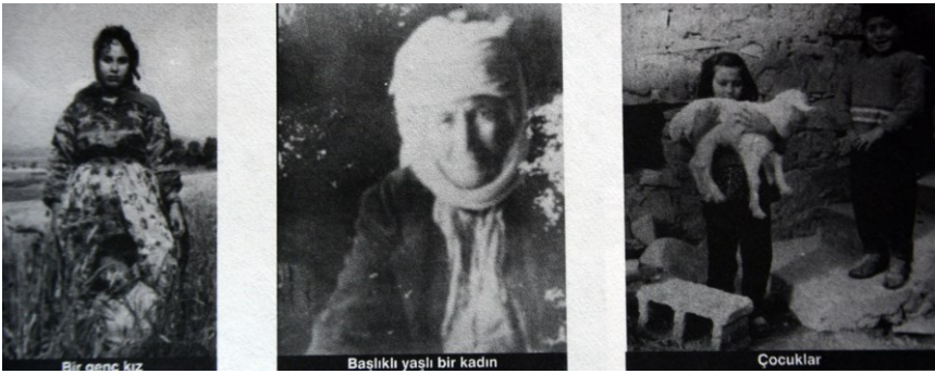
f. 9, 10, 11- Kırsealde kılık-kıyafet örnekleri

20. Asrın başında girdiğimiz peş-peşe dört savaşın henüz enkazını bile kaldıramadığımız bir dönemde ülkemiz için yeni bir savaş büyük bir riskti. Bu nedenle savaşa bulaşmamakla dört savaşın yıkıntılarında sonra oluşan bir avuç nüfusumuzu da İkinci Dünya Savaşında kaybetmekten kurtulduk. Bütün sıkıntılarına rağmen sağduyulu tarafsız bir politika izlemekle, anaları dul, çocukları öksüz bırakmadık. İkinci Dünya Savaşına giren ülkelerde milyonlarca insan öldüğünü düşünürsek, bu ateş çemberinde tarafsız kalabilmenin zorluğunu da anlarız. Çünkü savaşın kazananaı olmaz. Bu yüzden ki Roma’nın ünlü hukukçusu Cicero der ki: “En kötü barış, en haklı savaştan daha iyidir.”