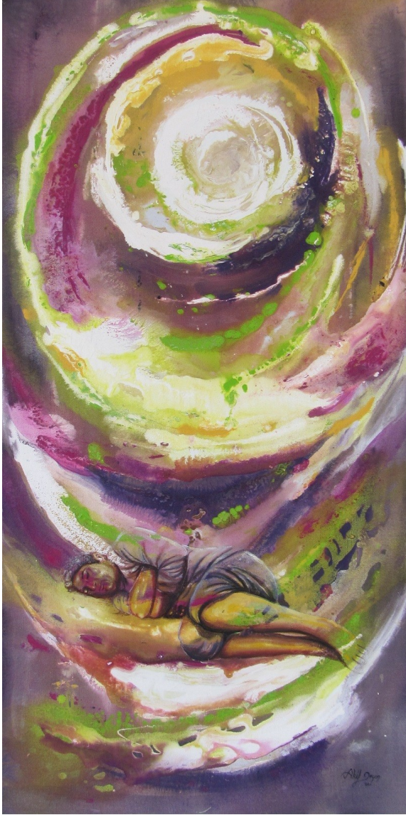
f. 82- kuyu önündeki adam

- Bana bu söyleşi fırsatını verdiğiniz, sanatseverlerle bizi buluşturduğunuz için asıl ben, kendim ve arkadaşlarım adına size teşekkür ediyor, saygılar sunuyorum.