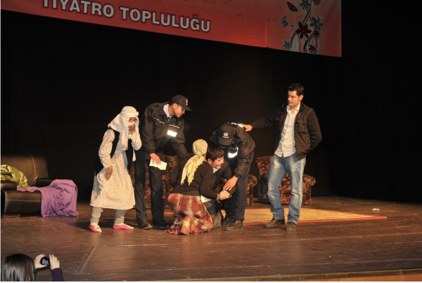
f. 72 - Oyundan bir bölüm