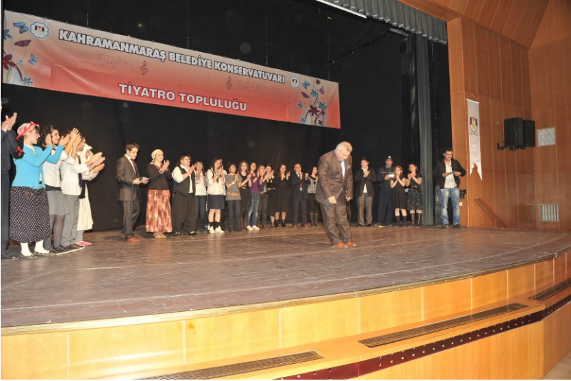
f. 71- Perde kapanışında yönetici ve ekibinden bir görüntü

05/ Şubat 2010 Cuma Akşamı Kahramanmaraş Belediye Tiyatrosu, Yerele Dönük Geleneksel Özgün Kültürü Sahneye Taşıyarak Seyirciyi, Kendi Kendisiyle Yüzleştirdi.