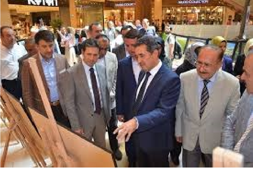
f. 54, 55- PIAZZA-AVM.'de “Kuşlarla Çırpınan Göl” Sergisinden görüntüler