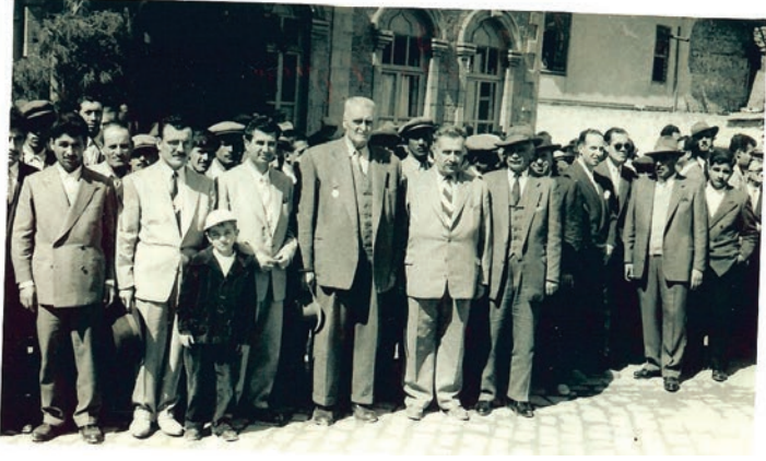
Bir Kurtuluş Bayramı Töreni