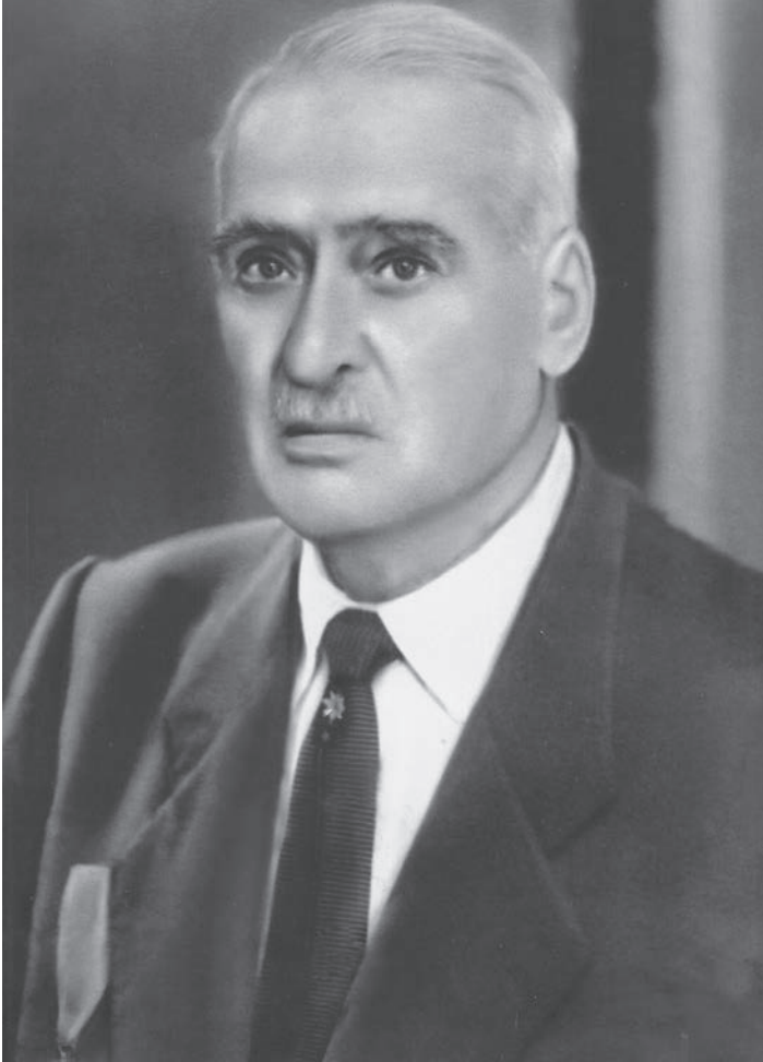
Arslan Bey Portresi