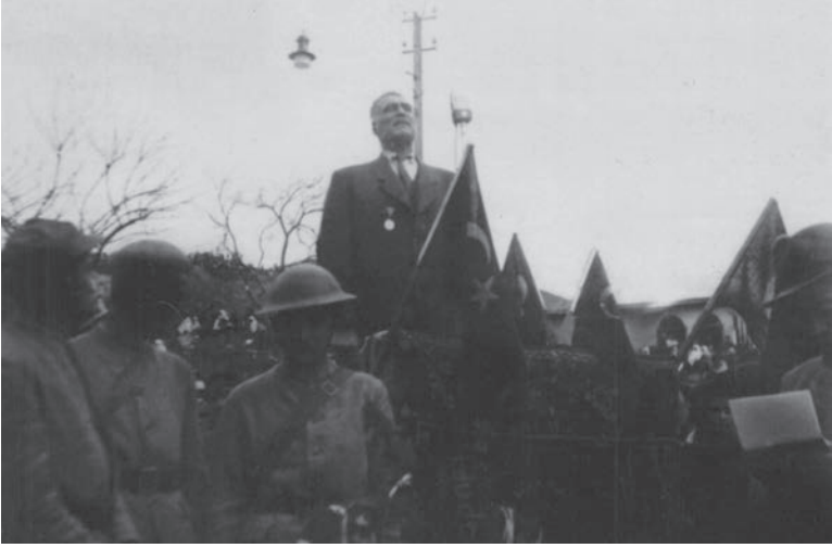
Bir Bayram Töreni

Engizek Gazetesi, Yıl 13, Sayı 3346, 11 Şubat 1960