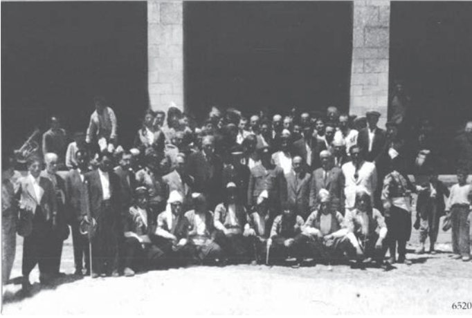
Müdafai Hukuk Cemiyeti Üyeleri İle