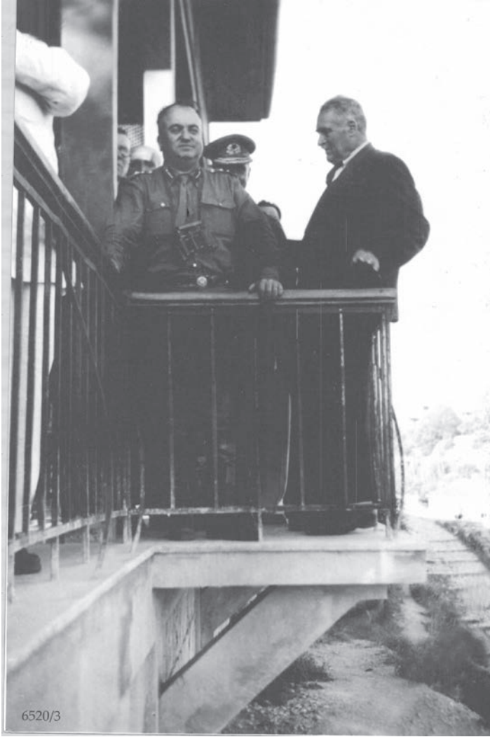
Bir Kurtuluş Bayramı Töreni