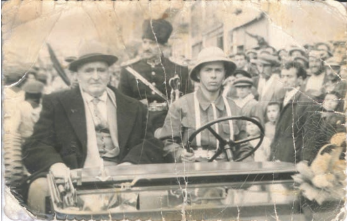
Bir Kurtuluş Bayramı Töreni