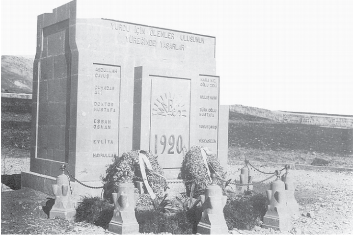
Şehadil Mezarlığındaki Şehitlik