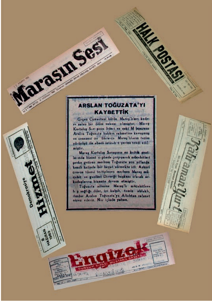
Vefat Haberinin Yer aldığı Mahalli Gazeteler