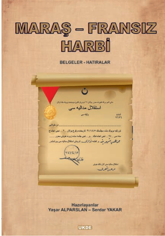
Arslan Beyin Notlarının Yer aldığı Kitap Kapağı