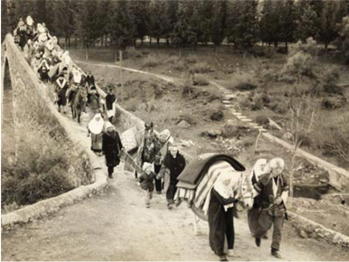
Kafkas Türklerinin Göç yolları