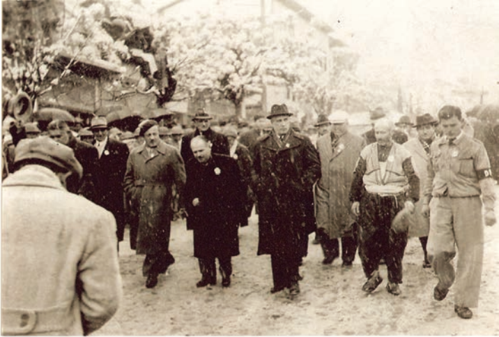
Bir Kurtuluş Bayramı Töreni