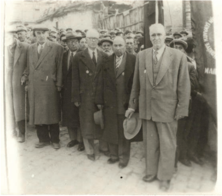
Bir Kurtuluş Bayramı Töreni