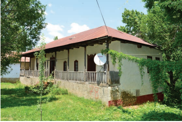
Göksun Fındık'ta Doğduğu Ev